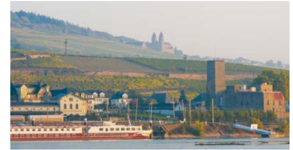
Rüdesheim, Kloster St. Hildegard