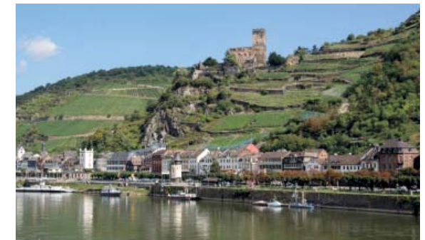
Kaub, Burg Gutenfels

Busfahrt durch das malerische UNESCO-Weltkulturerbe Mittelrhein - Rüdesheim, Kloster St. Hildegard (Vortrag durch eine Benediktinerin), Besuch des Grabes der Heiligen; zum Kloster Eberbach (Führung durch die gotische Anlage); mit Bus und Fähre zurück zur Ebernburg.