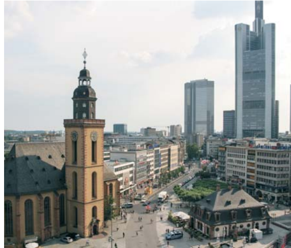
Frankfurt, Hauptwache und Katharinenkirche