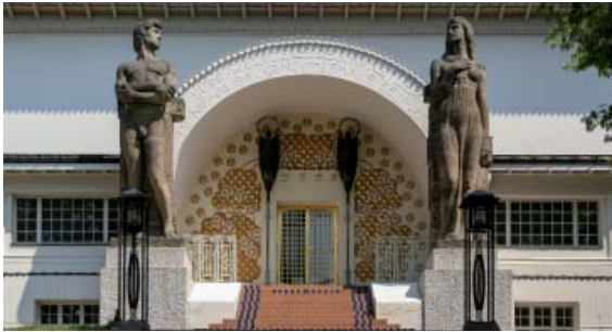
Mathildenhöhe, Ernst Ludwig-Haus